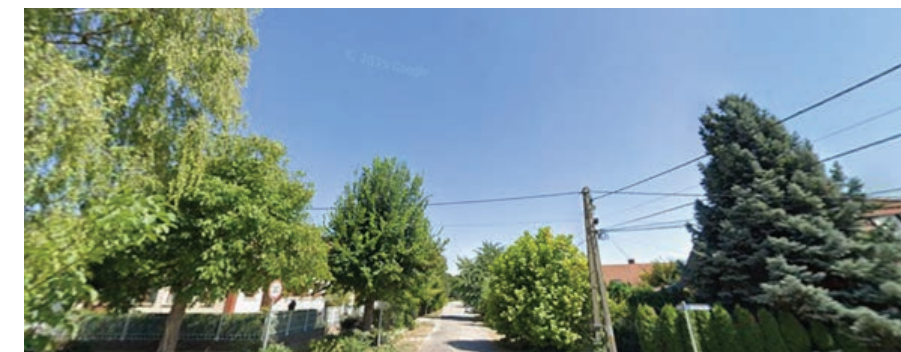
A Szél utca egy részletét a '60-as években a Mezőgazdasági és Növénytermesztő Szakmunkásképző Intézet tanulói fásították nyírfákkal és gyümölcsfákkal. Mára sajnos a fák nagy része elöregedett, melyeket folyamatosan pótolnak

Helyesbítés: Az előző számban tévesen jelent meg az 1848-as kopjafa megnevezése.